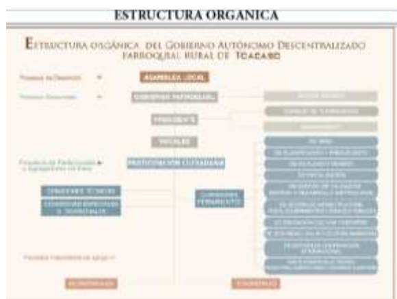
Ilustración 1; Orgánico Estructural del GADPRT

Artículo 6.- Mapa de procesos.- El Gobierno Parroquial para el cumplimiento de su misión y visión desarrolla procesos internos y está conformada por la siguiente estructura orgánica: